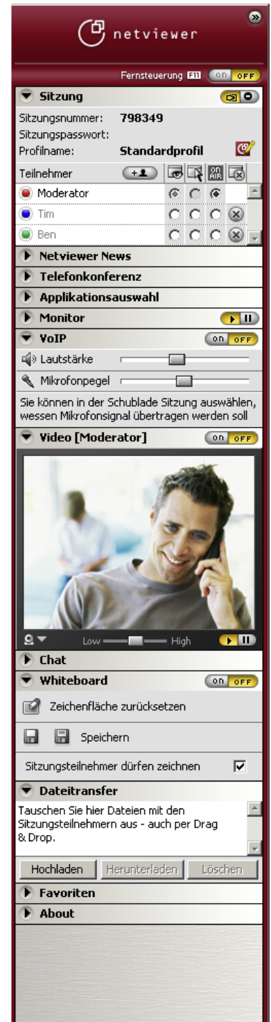
Das Netviewer Control Panel: Alle Funktionen auf einen Blick